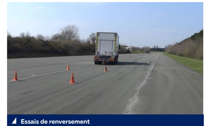
▲ Essais de renversement