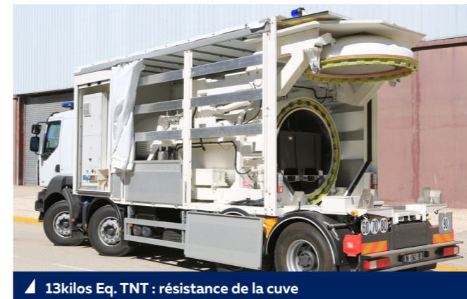
▲ 13kilos Eq. TNT : résistance de la cuve