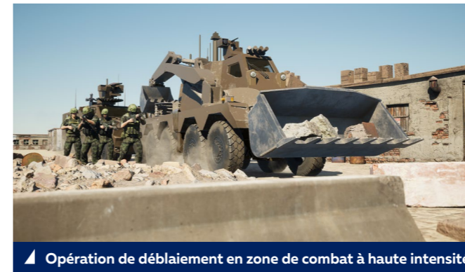
▲ Opération de déblaiement en zone de combat à haute intensité

Engin dual, l'EGC peut à la fois intervenir sur des zones de conflits mais également lors des catastrophes naturelles pour aider à déblayer le terrain et rétablir les itinéraires.