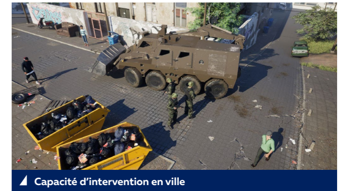
▲ Capacité d'intervention en ville