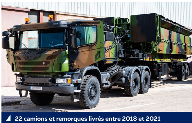
▲ 22 camions et remorques livrés entre 2018 et 2021

Les cabines ont notamment été blindées afin d'assurer une meilleure protection des opérateurs. L'intégration de rampes courtes directement aux modules ont permis de réduire l'empreinte logistique.