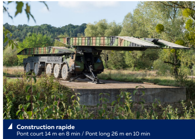
▲ Construction rapide Pont court 14 m en 8 min / Pont long 26 m en 10 min