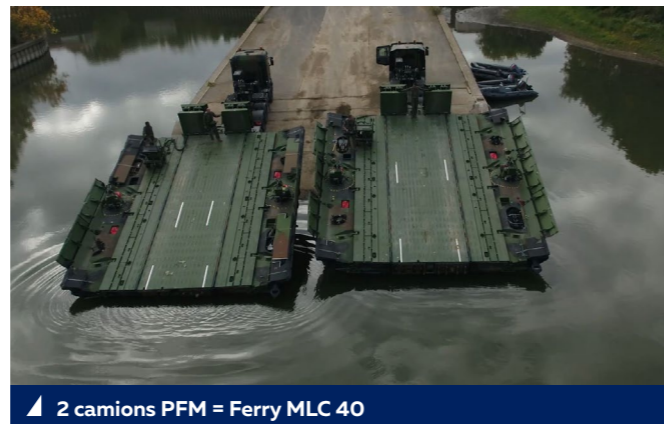
▲ 2 camions PFM = Ferry MLC 40