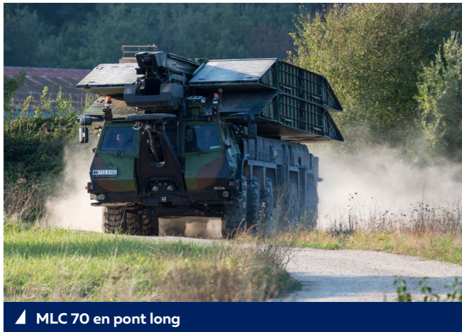
▲ MLC 70 en pont long

Doté d'une haute mobilité et d'une vitesse de pointe de 80km/h, le Pont d'Assaut Modulaire est un véhicule tout-terrain. Blindé, équipé d'un système de détection périmétrique pouvant déployer les travures de manière automatisé, ce pont d'assaut modulaire assure ainsi la sécurité des opérateurs.