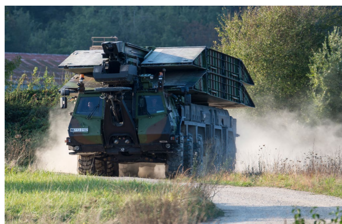
▲ MLC 70 en pont long

Doté d'une haute mobilité et d'une vitesse de pointe de 80km/h, le Pont d'Assaut Modulaire est un véhicule tout-terrain. Blindé, équipé d'un système de détection périmétrique pouvant déployer les travures de manière automatisé, ce pont d'assaut modulaire assure ainsi la sécurité des opérateurs.