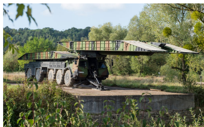
▲ Construction rapide Pont court 14 m en 8 min / Pont long 26 m en 10 min