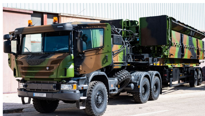
▲ 22 camions et remorques livrés entre 2018 et 2021

Les cabines ont notamment été blindées afin d'assurer une meilleure protection des opérateurs. L'intégration de rampes courtes directement aux modules ont permis de réduire l'empreinte logistique.