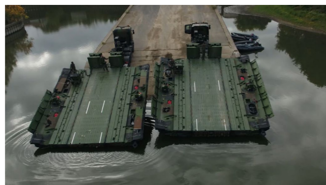
▲ 2 camions PFM = Ferry MLC 40