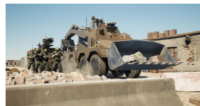
▲ Opération de déblaiement en zone de combat à haute intensité

Engin dual, l'EGC peut à la fois intervenir sur des zones de conflits mais également lors des catastrophes naturelles pour aider à déblayer le terrain et rétablir les itinéraires.