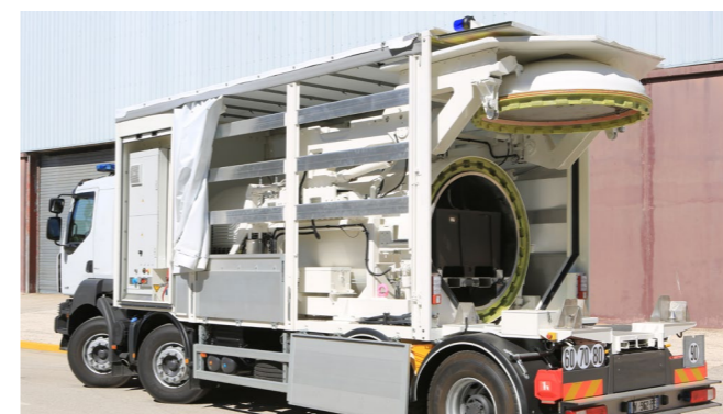
▲ 13kilos Eq. TNT : résistance de la cuve