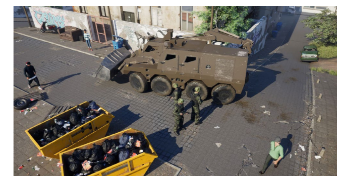
▲ Capacité d'intervention en ville