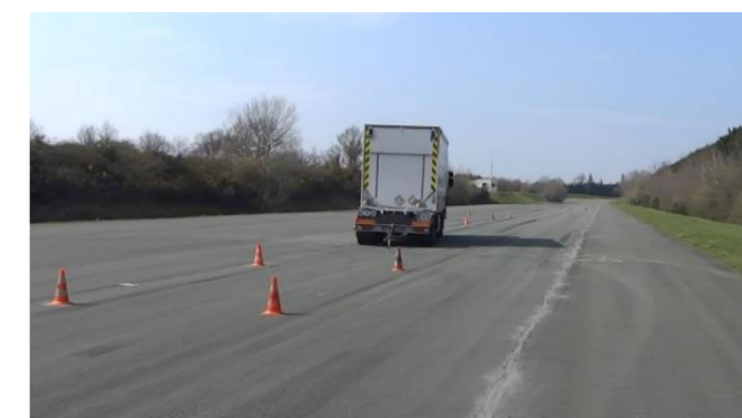
▲ Essais de renversement